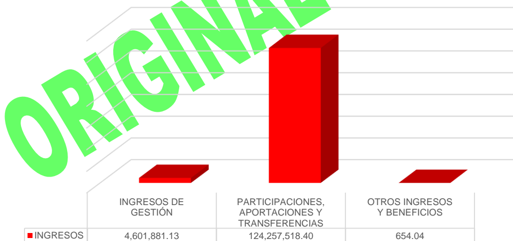
Gráfico 1. Ingresos